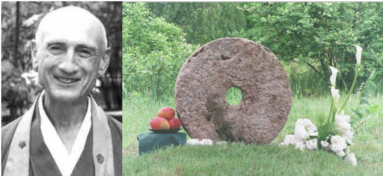
Tumba de Roshi