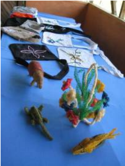
Artesanías de Las Pioneras