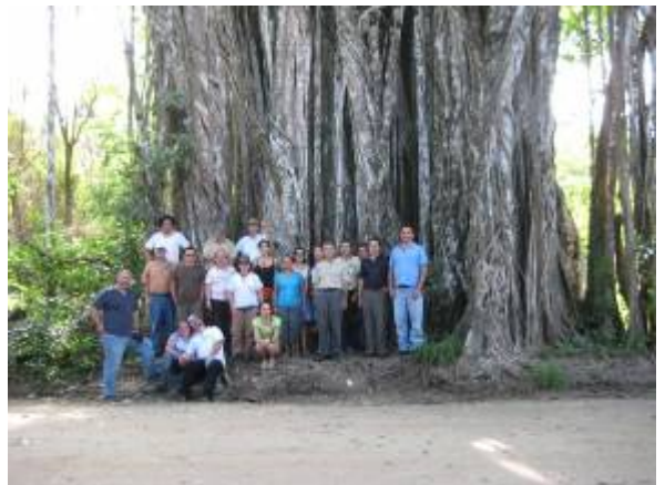
El grupo bajo los árboles gigantes de Cabuya