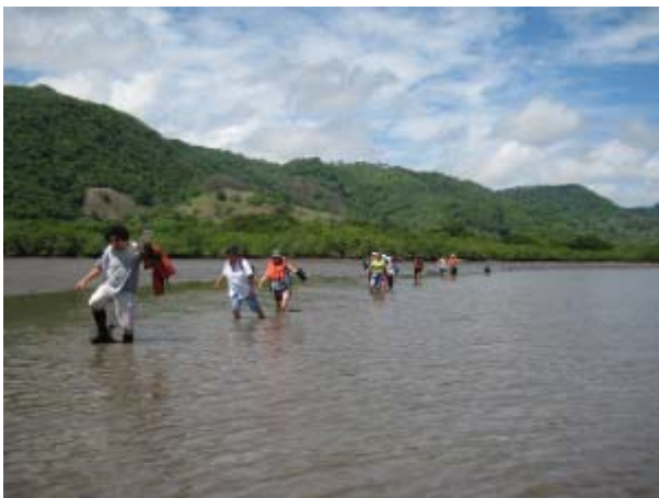
Caminando por el manglar