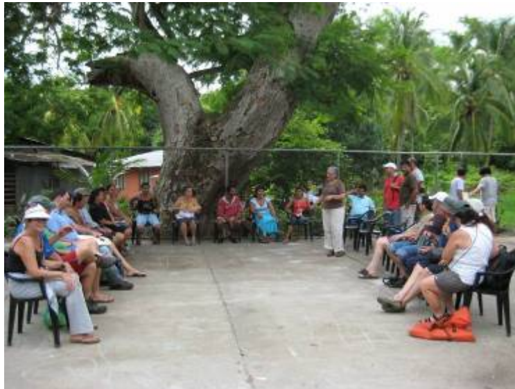
Cancha Multiusos en la comunidad de Jícaro