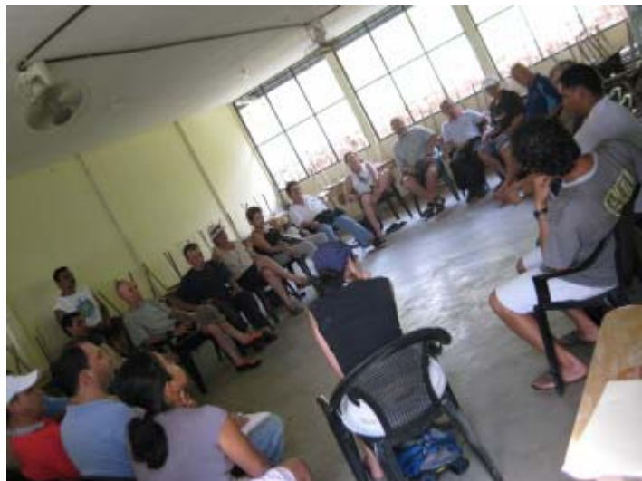
Reunión en aula de la Telesecundaria