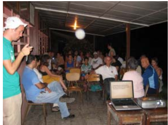
Reunión en la Escuela de Cabuya