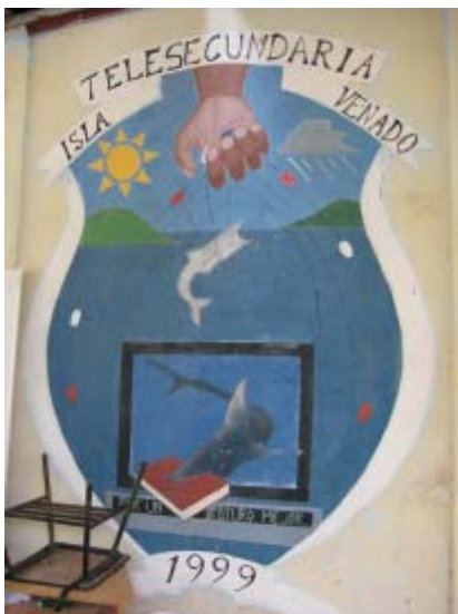
Escudo de la Telesecundaria

Se concluyó con un sabroso y bien preparado almuerzo por parte de Las Pioneras, donde luego el grupo aprovechó para observar y comprar artículos de artesanías hechas por estas mujeres.