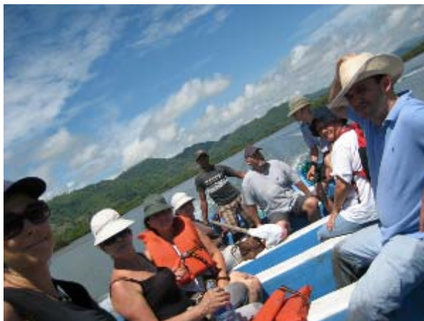
Viaje en una de las pangas