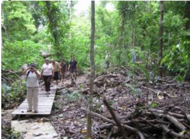
Caminata por la Reserva Absoluta Cabo Blanco

de que el grupo se acomodó en las instalaciones del Parque, se hizo una caminata por la Reserva Absoluta de Cabo Blanco, que sirvió para estirar el cuerpo e impregnarse de la natural belleza del lugar.