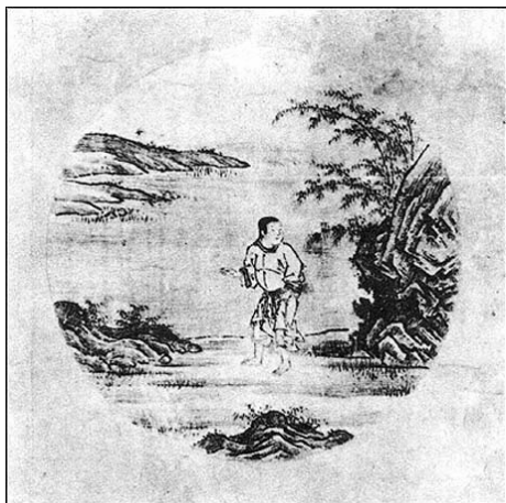
I. La búsqueda del buey

Casa Zen de Costa Rica, Sto. Domingo, Heredia. Tel (506) 2244 3532 y Telfax (506) 2244 71 70 Correo electrónico casazen@ice.co.cr Página Internet www.casazen.org